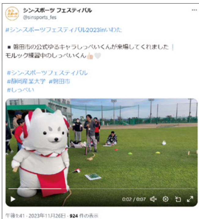
実際に発信した内容

シン・スポーツフェスティバルを通じて、初めてSNSの運用を主導に行いました。種目のルールや魅力を分かりやすく伝えるために短い文章にまとめることは大変でした。しかし、その投稿を見た人から反応を貰えたことにやりがいを感じました。当日は、自分が伝えたいと思った瞬間を写真で撮って発信する事が楽しかったです。