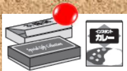
お菓子の箱・紙箱