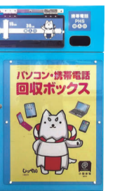
Tapunan ng Personal computer at Mobile phone

Lugar ng impormasyon: Iwata City Waste and Resource Recycling Division (Iwata Gomi Shigen Junkan-ka) Tel: 0538-37-4812 Fax: 0538-36-9797