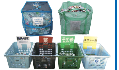
Containers na tapunan