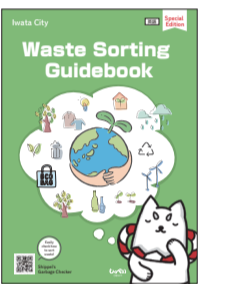
Gabay na aklat