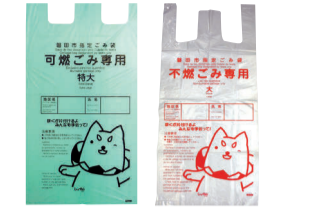
Nararapat na plastik bag ng basura