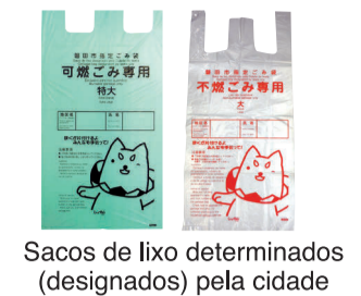
Sacos de lixo determinados (designados) pela cidade