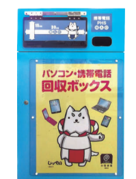
Caixa de coleta de computadores, notebooks e telefones celulares

Contato: Divisão de Reciclagem de Recursos de Resíduos de Iwata (Iwata Gomi Shigen Junkan-ka) Tel 0538-37-4812 Fax 0538-36-9797