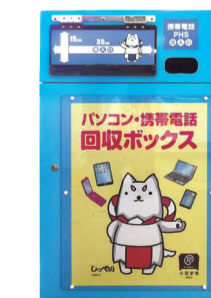
컴퓨터 휴대전화 회수 BOX

문의처: 이와타시 쓰레기 자원순환과 Tel 0538 -37- 4812 Fax 0538-36-9797