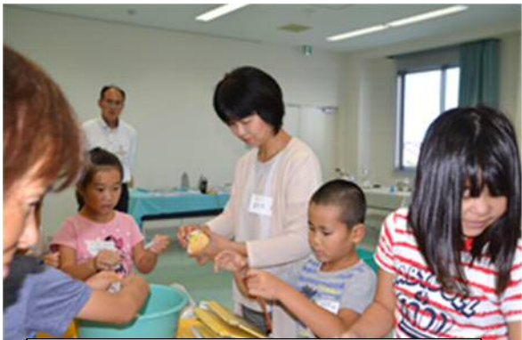
家で集めてきた雑がみをびりびりやぶいて雑がみもリサイクルできることを学んだよ