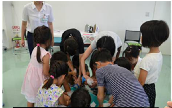
破った紙を水と一緒にミキサーにかけて水分を水切り器でギュッとしぼってみたよ