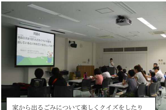
家から出るごみについて楽しくクイズをしたり DVDを真剣にみたよ