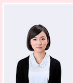
写真が引きすぎていて顔が確認し辛い