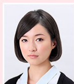
写真が正面を向いていない