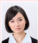
斜めに傾いている