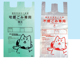
Bolsa de basura establecida.