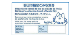
Etiquetas de recolecta