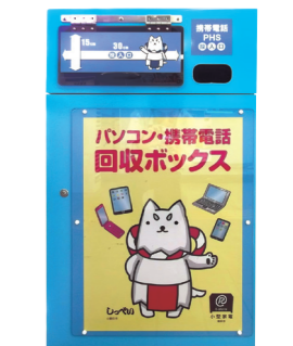
Cajas de recaudación para computadoras y teléfonos celulares.